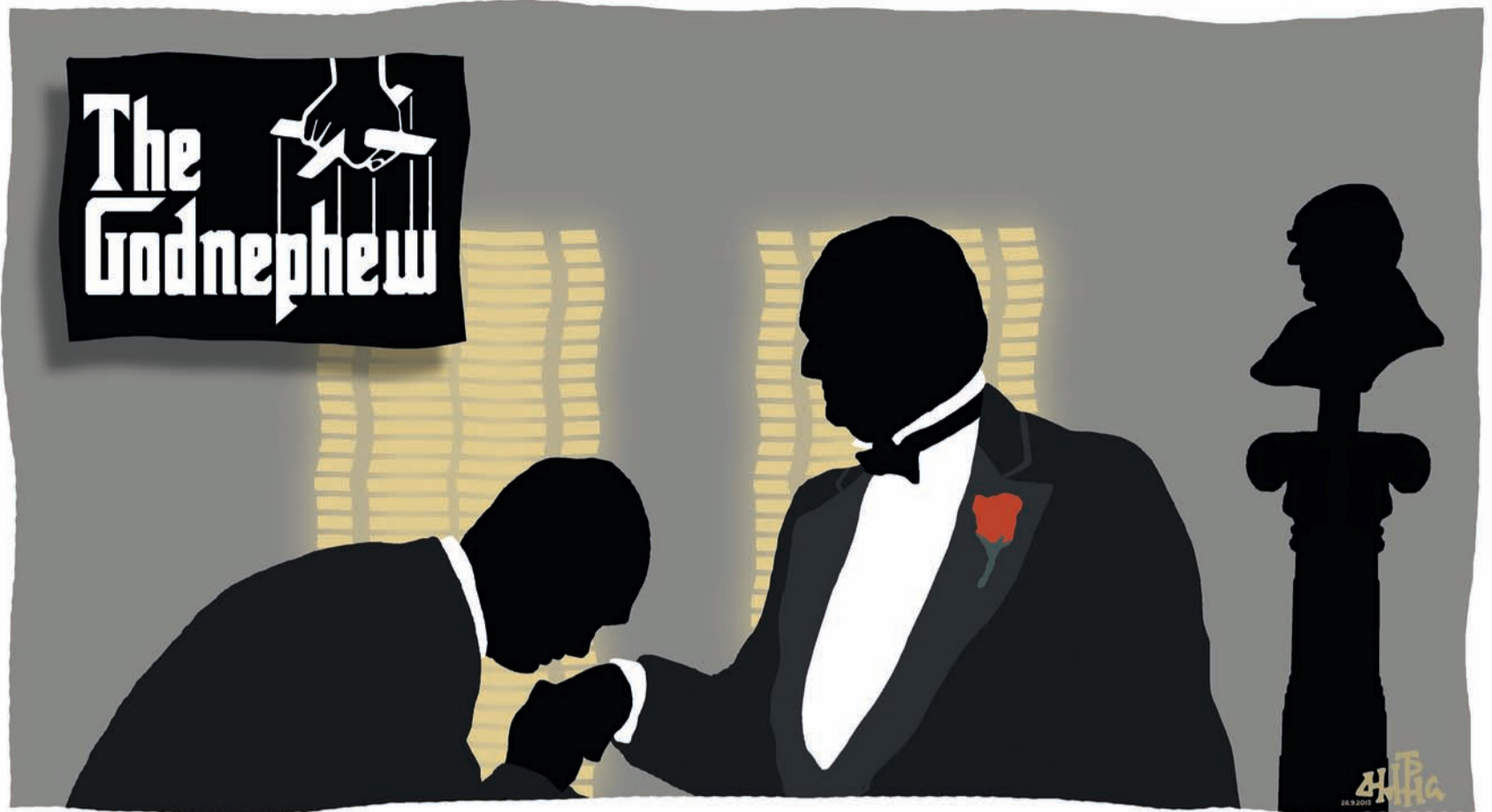
ΣΚΙΤΣΟ ΤΟΥ ΔΗΜΗΤΡΗ ΧΑΝΤΖΟΠΟΥΛΟΥ