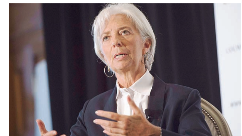
Η παγκόσμια ανάπτυξη θα είναι πιο αδύναμη το 2015 από το 2014, είπε η κ. Κριστίν Λαγκάρντ, ενώ το 2016 αναμένεται μόνον μια «μετριασθής επίταχυνση».

Εκροές 40 δισ. δολ. Τα σύννεφα πάνω από τις αναδυόμενες οικονομίες πολλαπλασιάζονται. Το τρίτο τρίμηνο οι εκροές από τις αναπτυσσόμενες χώρες ανήλθαν στα 40 δισ. δολ., καθώς οι επενδυτές ανασταλούν για τις επιπτώσεις που θα έχει η επικείμενη αύξηση των αμερικανικών επιτοκίων. Η Fitch εκτιμά ότι η Κίνα θα σημειώσει ανάπτυξη 6,3% το 2016 και 5,5% το 2017, ποσοστά κάτω από το 7% που θεωρείται απαραίτητο για να κινείται η κινεζική οικονομία.