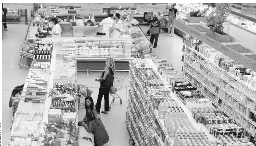
Υποχώρηση του κύκλου εργασιών κατά 2,3% καταγράφεται ακόμη και στα σούπερ μάρκετ.

Ο κύκλος εργασιών, όπως προκύπτει από τα στοιχεία της ΕΛΣΤΑΤ, υποχώρησε σε όλες τις κατηγορίες καταστημάτων πλην των πωλήσεων εκτός καταστημάτων, ένδειξη της ανάπτυξης