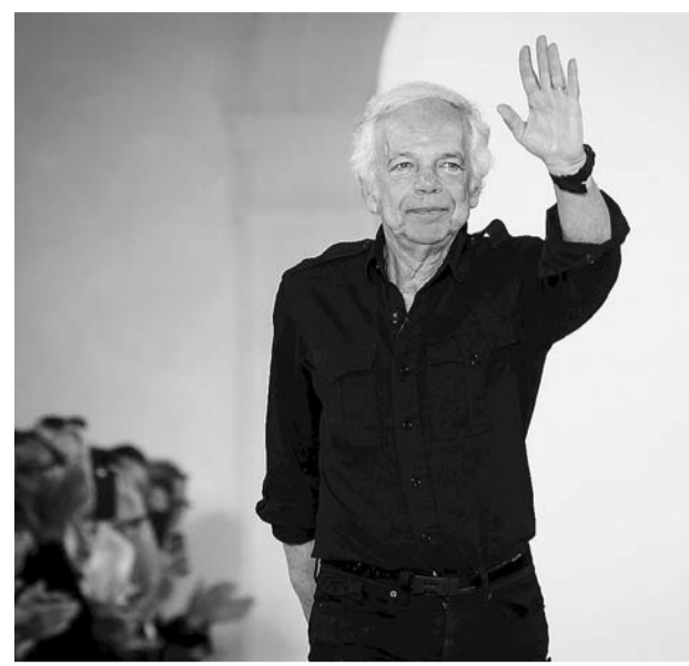
Ο 75χρονος Αμερικανός σχεδιαστής είχε ξεκινήσει την πορεία του στον χώρο της μόδας ως σχεδιαστής γραβατών.

Νέος επικεφαλής του ομίλου υψηλής ραπτικής ο Στέφαν Λάρσον, ο οποίος έχει εργαστεί στην H&M