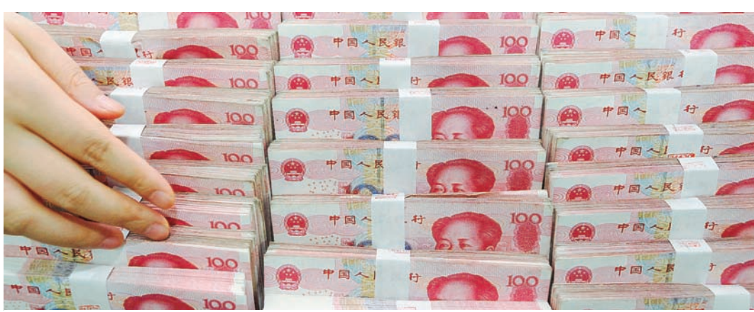
Η μεγαλύτερη της αναμενόμενης επιβράδυνση της κινεζικής οικονομίας αποτελεί τον βασικό λόγο για τις μεγάλες απώλειες των ευρωπαϊκών χρηματαγορών το τελευταίο διάστημα.

Το spread του ελληνικού δεκαετούς ομολόγου ενισχύθηκε και ανήλθε στις 765 μονάδες βάσης έναντι 761 μονάδων βάσης στη συνεδρίαση της Τρίτης. Η απόδοση του 10ετούς ομολόγου διαμορφώθηκε στο 8,25% από 8% την Τρίτη, η απόδοση του 5ετούς ομολόγου ανήλθε στο 9,10% από 9,05% και η απόδοση του 3ετούς ομολόγου έφθασε το 10,70% από 10,85%. Στα ομόλογα της Νότιας Ευρώπης, τα δεκαετή ομόλογα της Γαλλίας και της Ισπανίας είχαν αποδόσεις 1% και 1,89% αντίστοιχα. Η απόδοση του ιταλικού δεκαετούς ομολόγου υποχώρησε και διαμορφώθηκε στο 1,72% από 1,76% την Τρίτη, η απόδοση του πορτογαλικού δεκαετούς ομολόγου ανήλθε στο 2,40% από 2,44% την Τρίτη και, τέλος, η απόδοση του 10ετούς ιρλανδικού ομολόγου ανήλθε στο 1,22%.