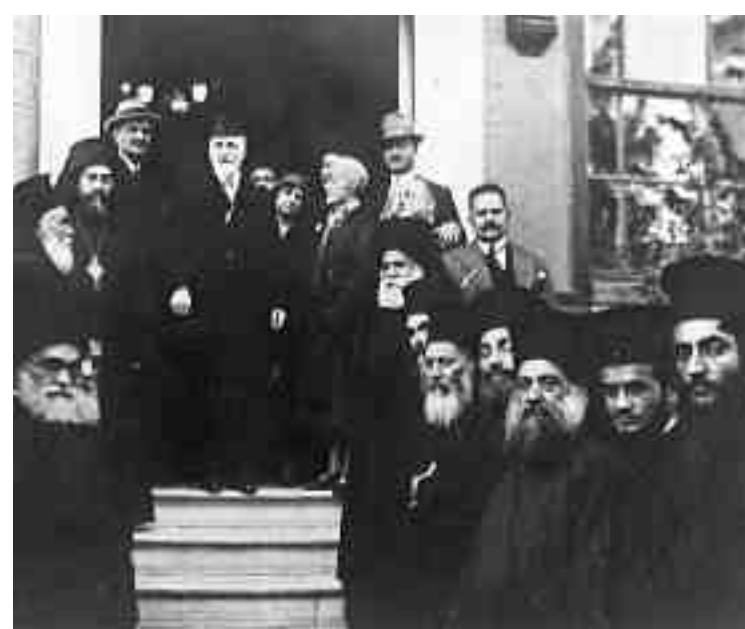
Ο Ελευθέριος Βενιζέλος με τη σύζυγό του κατά τη διάρκεια της επίσκεψής του στο Οικουμενικό Πατριαρχείο Κωνσταντινουπόλεως το 1930.