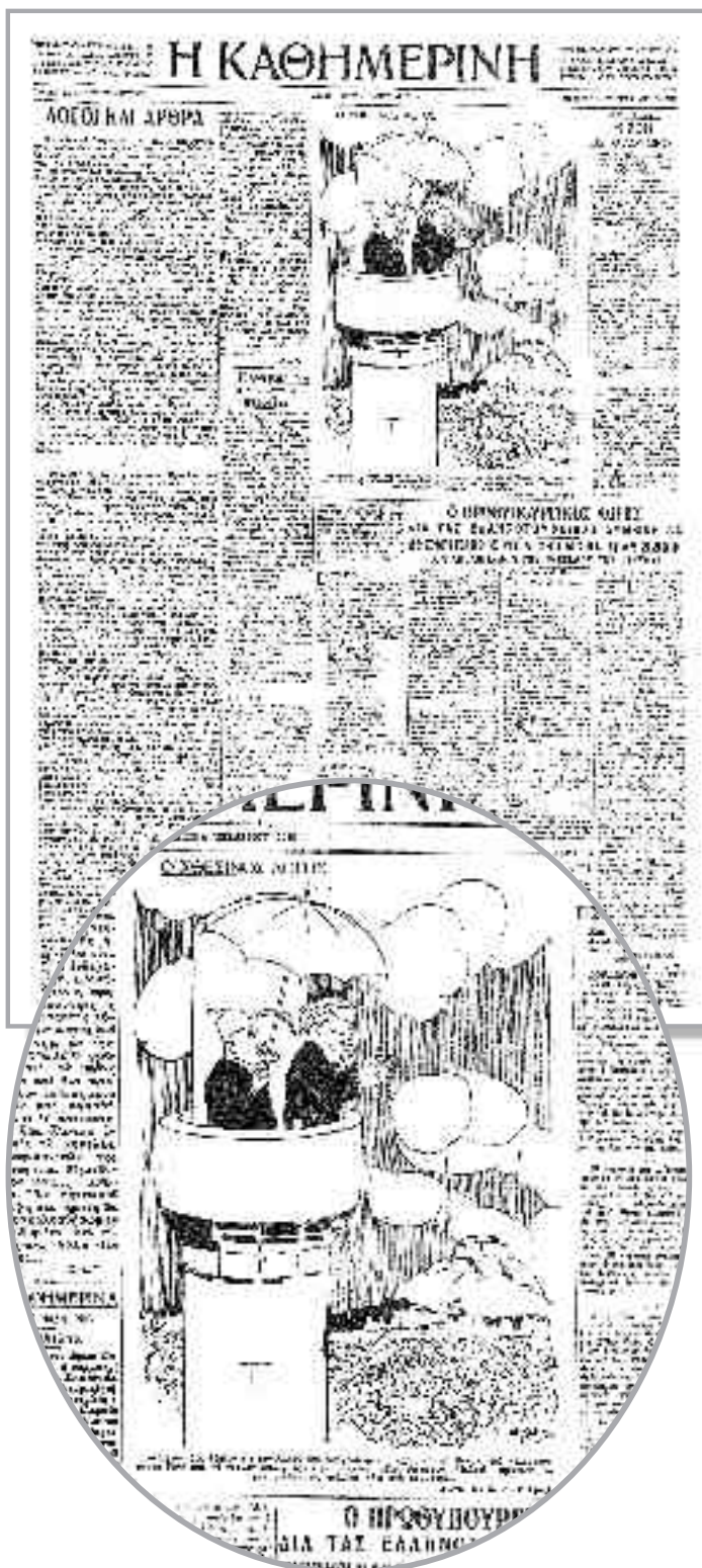
«Εφέντδες», έδωξαν εις τον Αλλάχ και υπεγράψαμεν προχθές εις το Κονάκι του πολυχρονεμένου Γαζί μας, το τρανόν μπουγιουρντί με το οποίον φίλοι είμαστεν, αδελφοί είμαστεν, παρέα γενήκαμεν, πόλεμος πάει στα κομμάτια..., εμφανίζεται να λέει ο τουρκοεπής Βενιζέλος από φανταστικό μινιάρ των Αθηνών στο συγκεντρωμένο πλήθος από κάτω, σε γελοιογραφία του Κ. Μπέζου στην πρώτη σελίδα της «Κ» που κυκλοφόρησε στις 4 Νοεμβρίου 1930.

Ήδη από το 1925-26 είχε γίνει σαφές ότι, βάσει της Σύμβασης, δεν ήταν καθόλου βέβαιο ότι η Τουρκία θα βρισκόταν στη θέση του οφειλέτη. Μάλιστα, μετά τη λεγόμενη «συμφωνία των Αθηνών» (Δεκέμβριος 1926), δηλαδή πριν από την επάνοδο του Βενιζέλου, η Αθήνα ανταλλάγη των πληθυσμών το 1922-23. Η βίαιη εκδίωξη των Ελλήνων από παράρχαιες εστίες στη Μικρά Ασία και την Ανατολική Θράκη υπήρξε γεγονός τραυματικό για τον Ελληνισμό, και η αποζημίωση των προσφύγων αποτελούσε μείζονα προσδοκία για την κοινή γνώμη. Ωστόσο, η Τουρκία δεν δεχόταν ότι βρισκόταν στη θέση του οφειλέτη, και πιέζε ασφυκτικά τον εναπομείναντα Ελληνισμό της Πόλης και το Οικουμενικό Πατριαρχείο κάθε φορά που επιδίωκε να προωθηθεί η θέσπις της στις σχετικές διαπραγματεύσεις. Έτσι, οι Έλληνες της Πόλης και το Οικουμενικό Πατριαρχείο