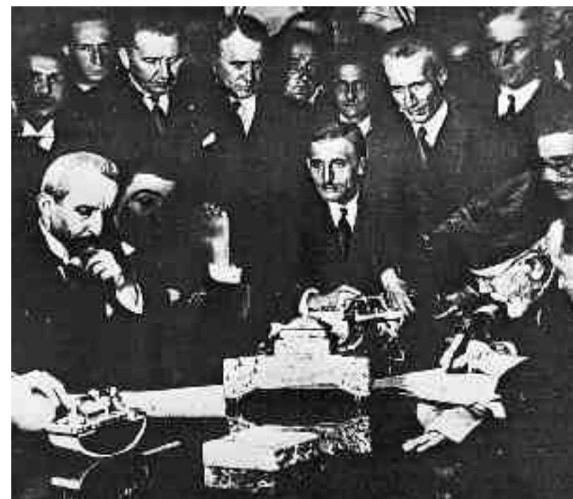
Αγκυρα, 30 Οκτωβρίου 1930. Ο Ελευθέριος Βενιζέλος υπογράφει το ελληνοτουρκικό Σύμφωνο Φιλίας. Απέναντί του ο Τούρκος πρωθυπουργός Ισμέτ Πασάς.