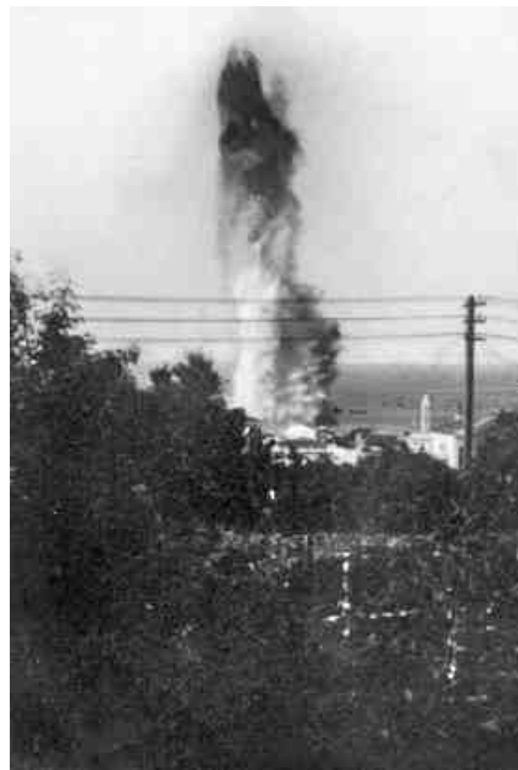
Η τορπίλη που εκτοξεύθηκε από το ιταλικό υποβρύχιο Delfino προκάλεσε έκρηξη στον λέβητα του καταδρομικού «Ελλης» και ρήγμα στο ύψος της ισάλο γραμμής του. Παρά τις προσπάθειες που έγιναν για να διασωθεί, η βύθισή του αποδείχτηκε εντέλει αναπόφευκτη. Δύο ακόμη τορπίλες που εκτοξεύθηκαν εναντίον επιβατηγών πλοίων στο λιμάνι της Τήνου, δεν βρήκαν τον στόχο τους.