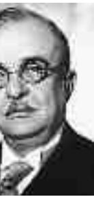
Οι απόψεις του Ελληνα δικτάτορα Ιωάννη Μεταξά (φωτ.) είχαν εννοκλήσει τον Μπενίτο Μουσολίνι.

Τα συνεχικά και ολοένα πιο προκλητικά αυτά επεισόδια δημιούργησαν εύλογη ανησυχία στην ηγεσία του Ελληνικού Πολεμικού Ναυτικού, στον βαθμό που εξέφρασε σοβαρές επιφυλάξεις όταν αποφασίστηκε από την ελληνική κυβέρνηση η συμμετοχή του εύδρομο καταδρομικού «Ελλης» στον εορτασμό της Κοίμησης της Θεοτόκου στο νησί της Τήνου. Η μονάδα αυτή, αν και σχετικά παλιά, αφού ναυπηγήθηκε τις παραμονές του Πρώτου Παγκοσμίου Πολέμου, είχε ριζικά ανακαινιστεί στη Γαλλία μεταξύ του 1925 και του 1927 και αποτελούσε την κυριότερη ναρκοθέτιδα του ελληνικού στόλου. Διέθετε επίσης δυνατότητες αποτελεσματικής συμμετοχής σε συνοδείες νηοπομπών και ανθυποβρυχιακές επιχειρήσεις. Οι επιφυλάξεις λοιπόν του Αρχηγού Στόλου, ναύαρχου Καββαδία και άλλων στελεχών του Πολεμικού Ναυτικού υπήρξαν εύλογες δεν οδήγησαν όμως στην αναίρεση της ληφθείσας απόφασης ίσως γιατί θεωρήθηκε ότι η εορτή της Κοίμησης της Θεοτόκου, που τιμάται πολύ και από τους καθολικούς Ιταλούς, δεν θα επέτρεπε την πραγματοποίηση μιας ακόμη προκλητικής ενέργειας εναντίον της χώρας μας.