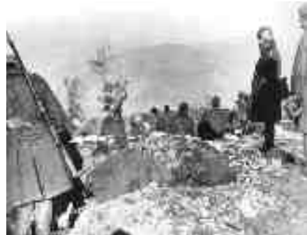
Ελληνες στρατιώτες σκάβουν χαρακώματα κατά μήκος της μεθορίου με την Αλβανία. Ο τορπιλισμός της «Ελλης» κατέδειξε ότι ο πόλεμος με την Ιταλία πλησίαζε.