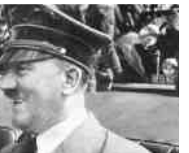
Τον Αύγουστο του 1940 , όταν κτηνήθηκε η «Ελλη», είχε πια καταστεί σαφές ότι οι εικονιζόμενοι Χίτλερ και Μουσολίνι είχαν αποφασίσει να αιματοκυλήσουν ολόκληρη την Ευρώπη. Η Ελλάδα δεν είχε άλλη επιλογή από την εμπλοκή της στον πόλεμο.

Η προετοιμασία του εδάφους για την εφαρμογή της επεκτατικής αυτής πολιτικής επιχειρήθηκε με μια σειρά από προκλήσεις ο χαρακτήρας των οποίων ήταν συχνά ναυτικός λό-