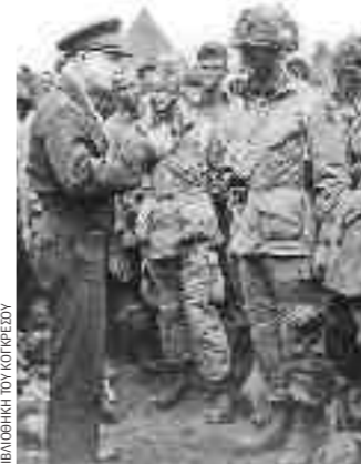
Ο στρατηγός Αϊζενχάουερ συνομιλεί με αλεξιπτωτιστές, το βράδυ της 5ης Ιουνίου 1944, λίγες ώρες πριν από την απόβαση.

Πάνω της προετοιμασίας και της μαχητικής ικανότητας των συμμαχικών δυνάμεων, αποφασιστικής σημασίας για την επιτυχία της απόβασης και την επιβίωση του προγεφυρώματος, τις πρώτες ειδικές μέρες, ήταν η υποστήριξη από τα πυροβόλα του πολεμικού ναυτικού και η πλήρης κυριαρχία στον αέρα της συμμαχικής πολεμικής αεροπορίας. Στην επιτυχία συντέλεσε και η πολύ σημαντική προσπάθεια σε επίπεδο σχεδιασμού, παραγωγής και συγκέντρωσης πολεμικού υλικού, αλλά και έρευνα και εφαρμογή μεγάλου αριθμού τεχνικών καινοτομιών που τελικά υποστήριξαν την επιχείρηση. Σχεδιάστηκαν και κατασκευάστηκαν σε μεγάλους αριθμούς αποβατικά σκάφη για τη μεταφορά προσωπικού, εφοδίων και αρμάτων μάχης. Κατασκευάστηκαν επίσης τεχνητά λιμάνια (Mulberry harbours) από προκατασκευασμένα τσιμεντένια μέρη και παλαιά πλοία που ρυμολκώθηκαν και ποντίστηκαν αμέσως μετά την απόβαση σε προεπιλεγμένα σημεία, δημιουργώντας αμφοβόλα όπου μπορούσαν να εκφορτωθούν προμήθειες και πολεμικό υλικό. Ακόμη, αναπτύχθηκαν οι διαμορφώθηκαν νέοι τύποι αρμάτων: αμφίβια άρματα μάχης, φλογόβόλα άρματα (Crocodiles), άρματα εκκαθάρισης ναρκοπέδιων (Crabs), οχήματα μηχανικού εξοπλισμένα για καταστροφή οχυρώσεων (AVRE), οχήματα για γεφυροποιία κ.λπ.