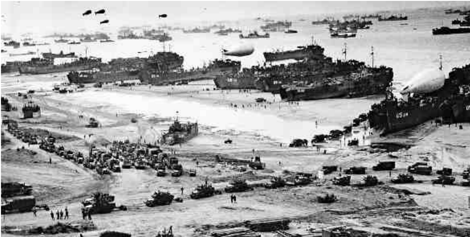
Αμερικανικά αποβατικά σκάφη ξεφορτώνουν άρματα και υλικό πολέμου στην ακτή «Ομαχα». Η απόβαση στη Νορμανδία θεωρείται η μεγαλύτερη αμφίβια πολεμική επιχείρηση της Ιστορίας.

Τα σχέδια προέβλεπαν απόβαση 156.000 ανδρών, της 1ης Αμερικανικής Στρατιάς, (73.000 περίπου) και της 2ης Βρετανικής Στρατιάς (περίπου