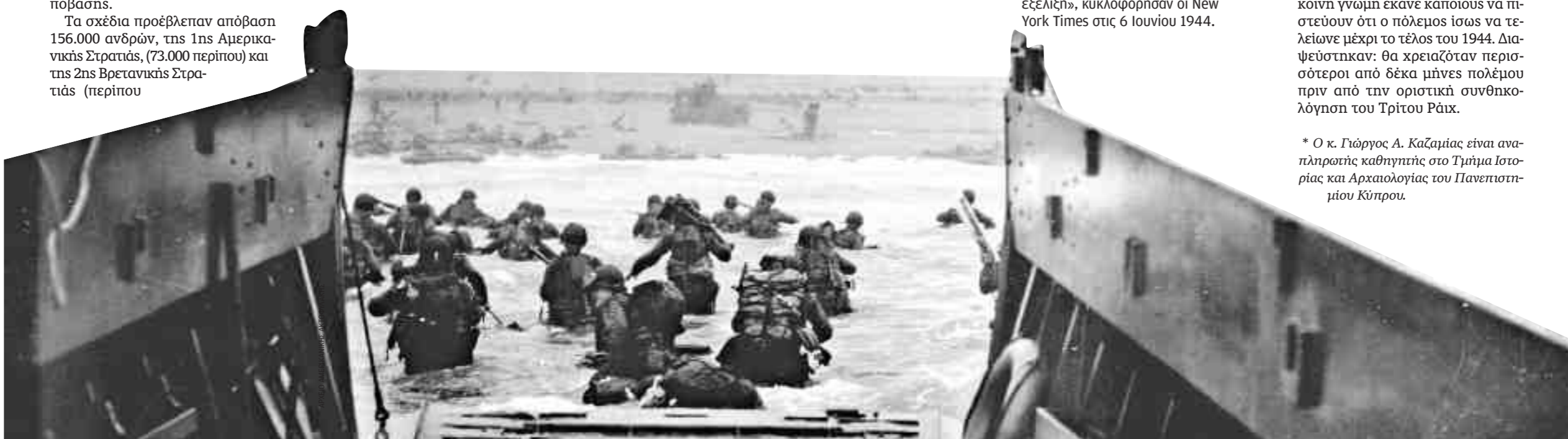
«Στα σαγόνια του θανάτου». Ετσι ονομάζεται η παραπάνω φωτογραφία, μία από τις σημαντικότερες όλων των εποχών. Στρατιώτες της Αμερικανικής 1ης Ταξιαρχίας Πεζικού αποβιβάζονται από σκάφος της Ακτοφυλακής (το ενονομαζόμενο και «ταξί προς την Κόλαση») στις ακτές της Νορμανδίας.