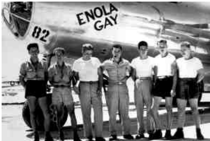
Το πλήρωμα του B-29 Enola Gay, που βομβάρδισε τη Χιροσίμα.

η ατομική βόμβα διαμόρφωσε αποφασιστικά τον χαρακτήρα του μεταπολεμικού διεθνούς συστήματος καθώς η ψυχροπολεμική εποχή που ακολούθησε διατήρησε τον αρχικό χαρακτήρα μιας ιδεολογικής και κοινωνικοπολιτικής διαμάχης, χωρίς να κλιμακωθεί σε γενικευμένη ένοπλη ρήξη, εξαιτίας του γεγονότος ότι η περίφημη «ισορροπία του τρόμου» απέτρεψε οποιαδήποτε διένεξη των δύο υπερδυνάμεων στο στρατιωτικό πεδίο.