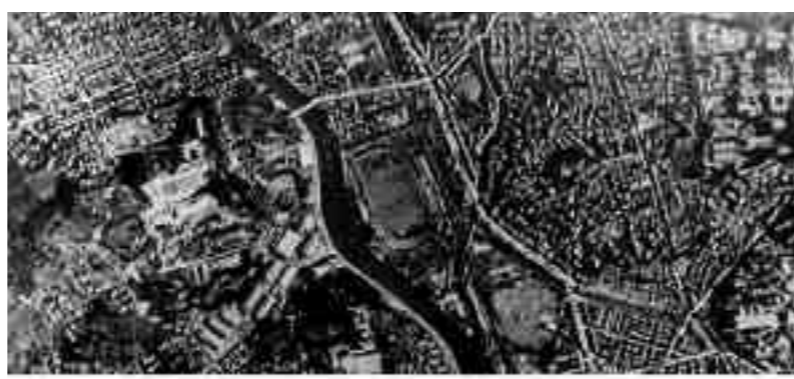
Η Χιροσίμα πριν (επάνω) και μετά (κάτω) την έκρηξη της ατομικής βόμβας. Η πόλη μετατράπηκε κυριολεκτικά σε χέρσο οικόπεδο, στις 6 Αυγούστου 1945.

Στις έντεκα το πρωί, το αμερικανικό βομβαρδιστικό έριξε την ατομική βόμβα Fat Man πάνω από τη βιομηχανική περιοχή του Ναγκασάκι, η οποία εξεργάγη 469 μέτρα πάνω από το έδαφος και προκάλεσε τον θάνατο περίπου 40.000 ανθρώπων, ενώ άλλοι τόσοι πέθαναν τους επόμενους έξι μήνες από τις παρενέργειες της έκρηξης.