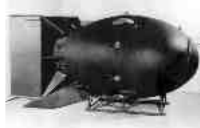
Η ατομική βόμβα Fat Man που έπληξε το Ναγκασάκι.

Οι ΗΠΑ χρησιμοποίησαν τη βόμβα για να λήξει ο πόλεμος ταχύτερα, με μικρότερες απώλειες, αλλά και για τις διπλωματικές δυνατοότητες που τους έδινε.