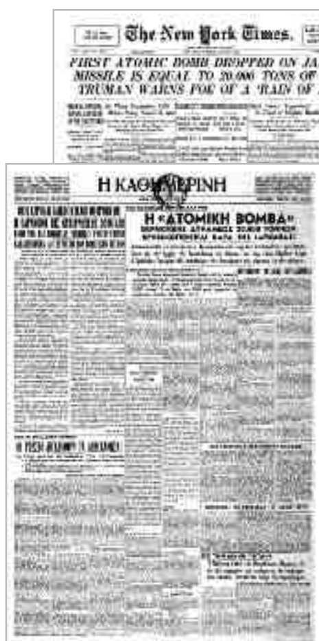
«Η Χιροσίμα επλήγη από ατομική βόμβα ισχύος 20.000 τόνων TNT» αναγγέλλουν στα πρωτοσέλιδα της 7ης Αυγούστου 1945 η «Καθημερινή» και οι New York Times.

αποφασίστηκε, εκτός από το διεθνές μεταπολεμικό καθεστώς, και ο τρόπος αντιμετώπισης της Ιαπωνίας. Στις 26 Ιουλίου, η διακήρυξη του Πότσνταμ έθετε τις προϋποθέσεις και τους όρους συνθηκολόγησης της Ιαπωνίας. Σε αντίθεση περίπτωση, οι Σύμμαχοι θα προέβιναν στην «ολοκληρωτική συντριβή των ιαπωνικών δυνάμεων και αναπόφευκτα στον αφανισμό της ιαπωνικής γης». Στη διακήρυξη δεν υπήρχε καμία αναφορά στην ατομική βόμβα. Δύο ημέρες αργότερα, οι Ιάπωνες μέσω του πρωθυπουργού τους Καντάρο Σουζούκι απέρριψαν την πρόταση των Συμμάχων.