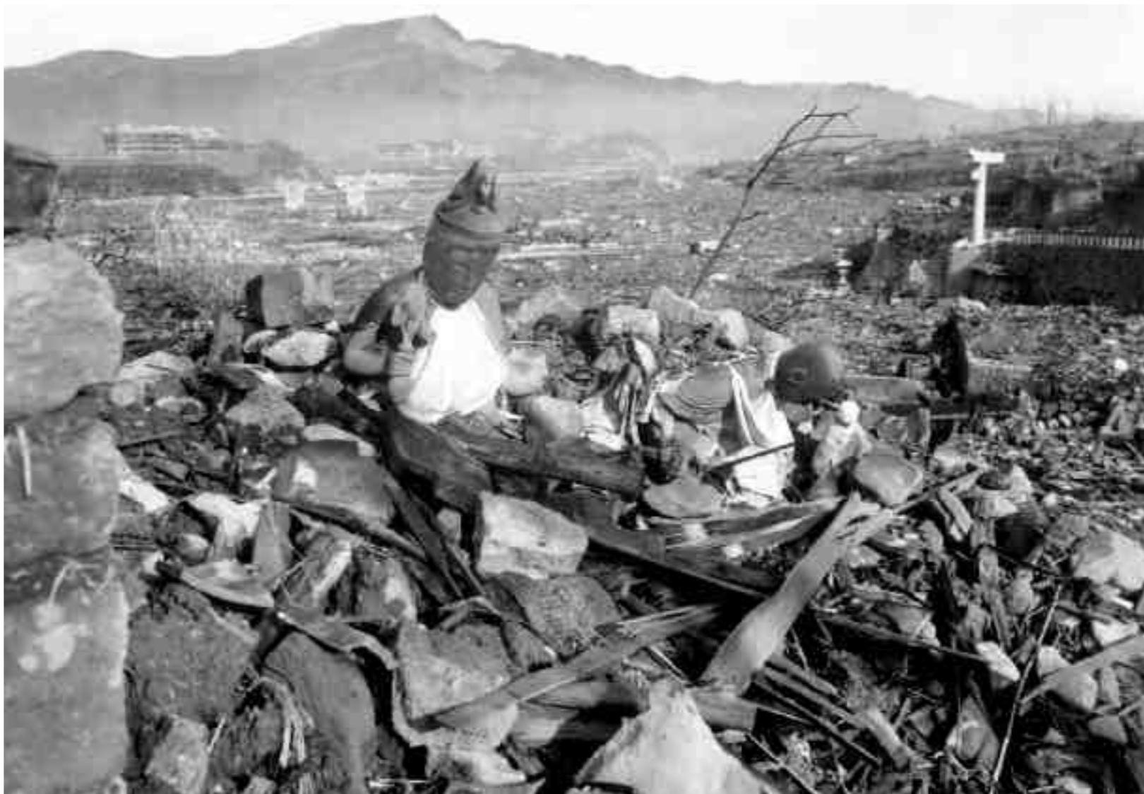
Απόλυτη καταστροφή και 40.000 νεκρούς άφησε πίσω της η πυρηνική έκρηξη στο Ναγκασάκι της Ιαπωνίας, στις 9 Αυγούστου 1945. Στη φωτογραφία, ισοπεδωμένος ναός.

Στις 9 Αυγούστου, το αμερικανικό βομβαρδιστικό B-29 Superfortress Bockscar, με κυβερνήτη τον Charles Sweeney, απογειώθηκε και αυτό από τη βάση Tinian με πρώτο στόχο τον βομβαρδισμό της Κοκούρα και δεύτερο το Ναγκασάκι. Επειδή, όμως, η πόλη της Κοκούρα ήταν καλυμμένη με σύννεφα και το πλήρωμα δεν είχε οπτική επαφή, αποφασίστηκε η επιλογή του εναλλακτικού στόχου, της πόλης του Ναγκασάκι. Και αυτή η προσέγγιση εντοπίστηκε από τα ιαπωνικά ραντάρ αλλά δεν δόθηκε η εντολή ανακαίτησης, διότι τα αμερικανικά βομβαρδιστικά ήταν μόνο δύο και η πτήση θεωρήθηκε αναγνωριστική.