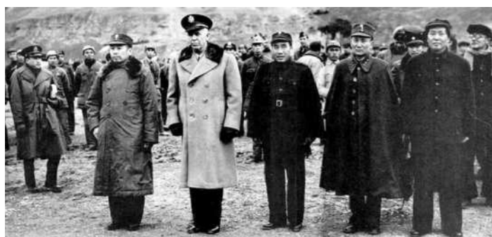
Ο Αμερικανός στρατάρχης Μάρσαλ μαζί με τους Μάο και Τσανγκ Κάι Σεκ (δεξιά και οι δύο) λίγο πριν ξεσπάσει ο εμφύλιος.

Μια άλλη στρατηγική του Μάο που αποδείχθηκε σοφή ήταν να δίνει προτεραιότητα στην κατάληψη των αγροτικών περιοχών και όχι των πόλεων. Επρόκειτο για μια ευρύτερη α-