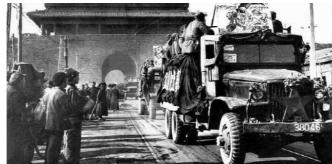
1949. Τα κομμουνιστικά στρατεύματα εισέρχονται πανηγυρικά στο Πεκίνο. Η επικράτηση του Μάο δεν αμφισβητείται.