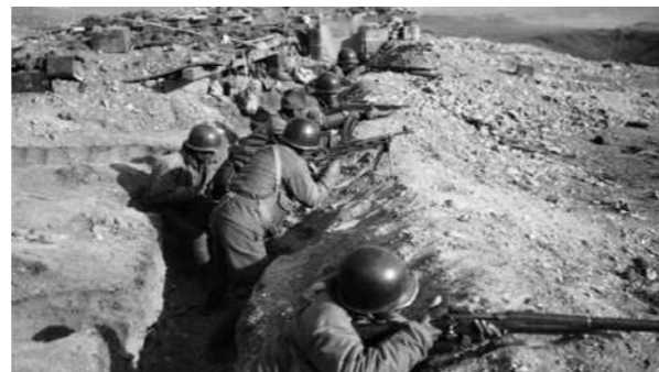
1946. Άνδρες του εθνικιστικού στρατού προσπαθούν να αποκρούσουν τους κομμουνιστές στη Μαντζουρία.