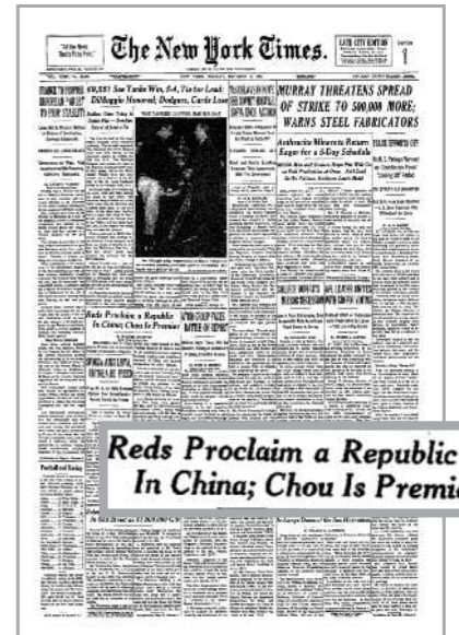
Ο New York Times ανέφερεν στο πρωτοσέλιδο της 2ας Οκτωβρίου του 1949 την ανακήρυξη της Λαϊκής Δημοκρατίας της Κίνας από τον Μάο. «Οι Κόκκινοι ανακηρύσσουν κράτος στην Κίνα», είναι ο τίτλος του σχετικού άρθρου, με την επισήμανση ότι πρωθυπουργός αναλαμβάνει ο Τσου.