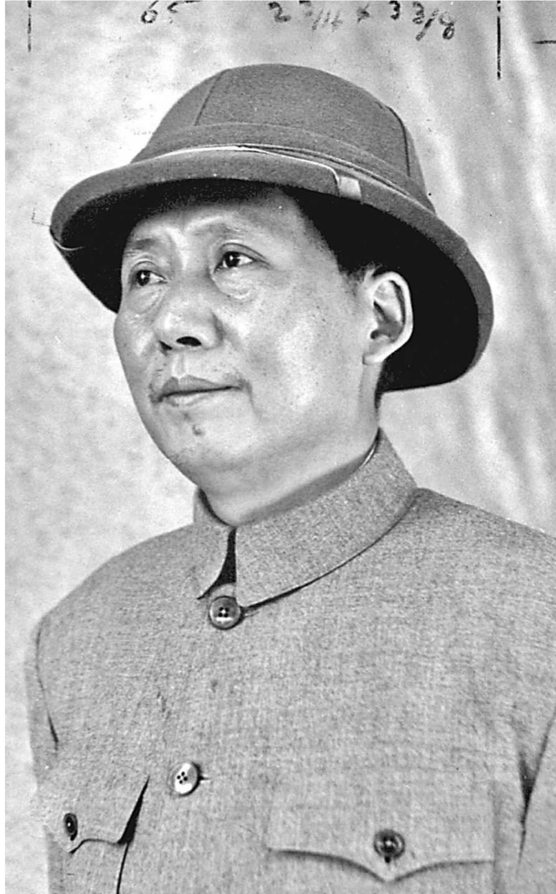
Ο Μάο αναδείχθηκε θριαμβευτής του εμφύλιου πολέμου, χάρη τόσο στην ταλπηρή του στρατηγική όσο και στην άμεση αγροτική μεταρρύθμιση, η οποία προκάλεσε, εντέλει, ασφυξία στις μεγάλες πόλεις.

Τον Ιούνιο του 1947 οι δυνάμεις του Μάο πέρασαν για πρώτη φορά από τη στρατηγική άμυνα στις στρατηγικές επιθέσεις και άρχισαν να κερδίζουν έδαφος από τους εθνικιστές. Ο Μάο εκτιμούσε ότι θα εξουδετέρωνε τον στρατό του Τσανγκ Κάι Σεκ εντός τριετίας. Εντούτοις, η έκβαση του πολέμου εξελίχθηκε για τον ίδιο πολύ καλύτερα από ό,τι είχε αρχικά υπολογίσει. Από το 1947 μέχρι το 1948 οι κομμουνιστές είχαν κατορθώσει να θέσουν υπό τον έλεγχό τους το 99% του εδάφους της Μαντζουρίας και το 85% της γης βόρεια του ποταμού Γιανγκτσέ. Η βόρεια Κίνα ήταν ήδη χαμένη για τον Τσανγκ Κάι Σεκ.