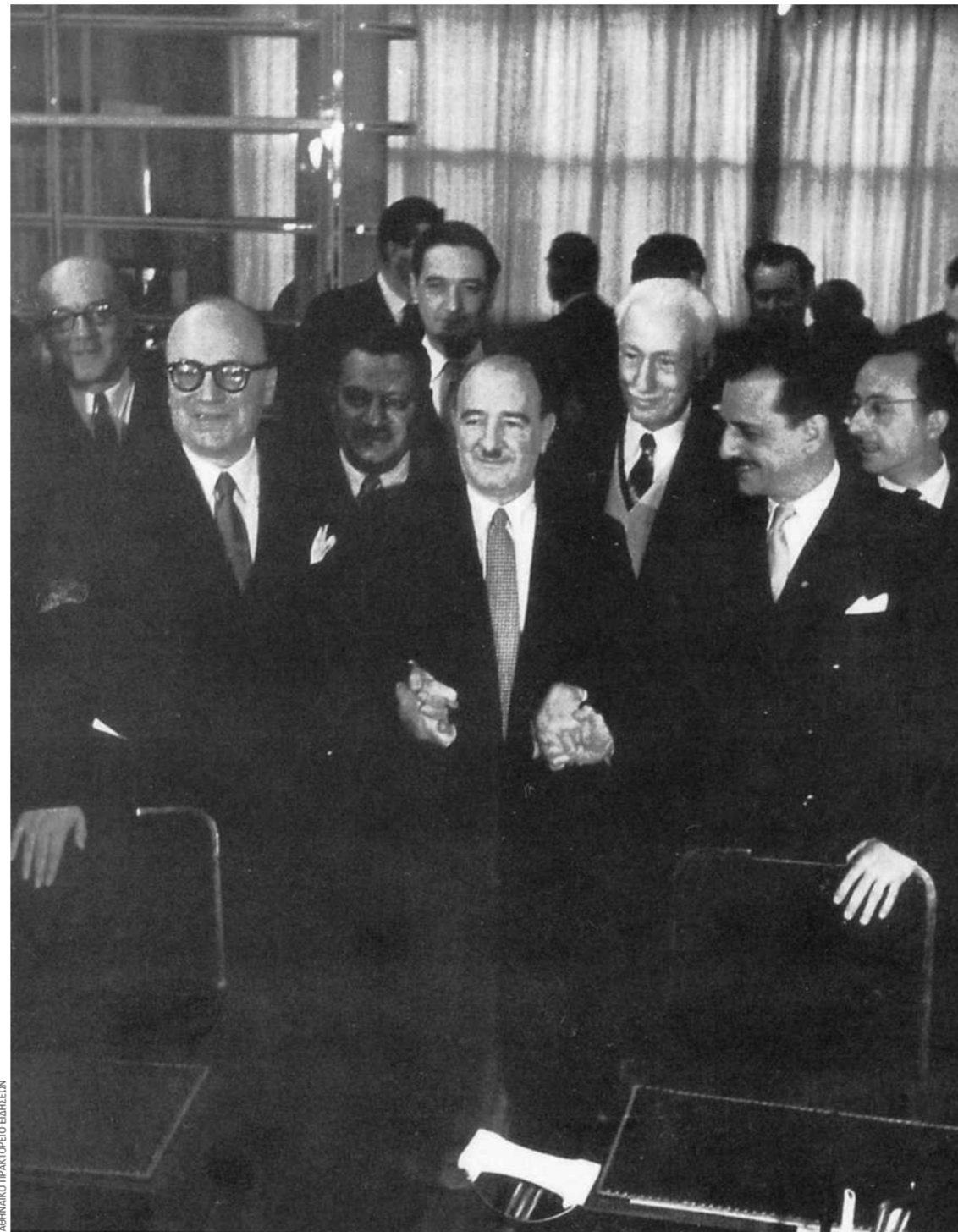
ΑΡΧΙΜΑΘΟΣ ΠΡΑΚΤΟΡΙΟΥ ΕΜΠΕΣΤΩ

αποτυχία των παράλληλων στρατιωτικών συνομιλιών του Βελιγραδίου με τις δυτικές δυνάμεις, και συγκεκριμένα με την αντιπροσωπεία υπό τον στρατηγό Τόμας Χάρντι, λεπτομέρειες των οποίων δεν γνώριζαν ούτε η Αθήνα ούτε η Αγκυρα. Όπως αναφέρει ο Τζορτζ Άλλεν, πρόεδρος των ΗΠΑ στο Βελιγράδι εκείνη την περίοδο «η αυξημένη δεκτικότητα των Τούρκων και των Ελλήνων στη διεύρυνση του πεδίου των συνομιλιών σε αντίθεση με τα στενά πλαίσια των όρων αναφοράς του Χάρντι, ειδικά στο πολιτικό πεδίο, θεωρούμε ότι